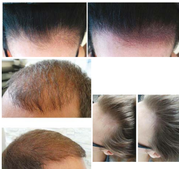
Fot. 3 Zagęszczanie włosów

Warunkiem odpowiedniego efektu w przypadku zagęszczania jest stosunkowo ciemny kolor włosów naturalnych. Zabieg ten nie jest polecany przy ciepłych odcieniach blondu.