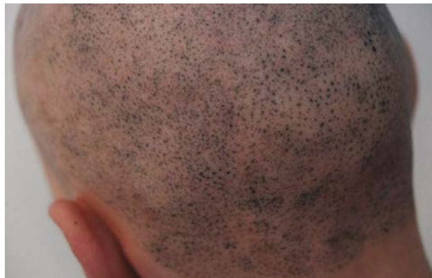
Fot. 6 Przykłady nieudanej pigmentacji skóry głowy

Dla osób bez odpowiedniego przeszkolenia zabieg pigmentacji skóry głowy, który budzi coraz większe zainteresowanie wśród klientów, wydaje się być na pierwszy rzut oka niezwykle prostym, polegającym na wykropkowaniu, pozbawionego włosów, obszaru skóry głowy.