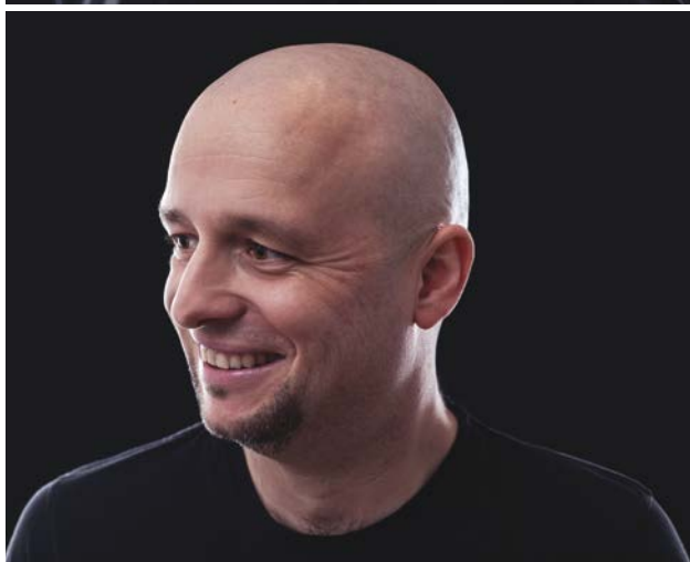
Fot. 1, 2 Efekt „ogolonej głowy”