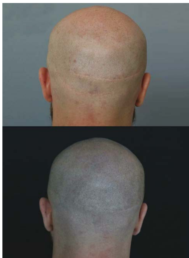
Fot. 4 Kamuflaż blizn

Blizny, które są zazwyczaj dużo jaśniejsze od zdrowej skóry, przykuwają uwagę zarówno nienaturalnym kolorytem, jak i strukturą. Pigmentacja pozwala znacznie wyeliminować ten problem. Należy jednak pamiętać, że „krycie kolorem” blizn nie jest jednak tematem łatwym i wymaga doświadczenia i specjalistycznych umiejętności pracy na tak trudnym obszarze.